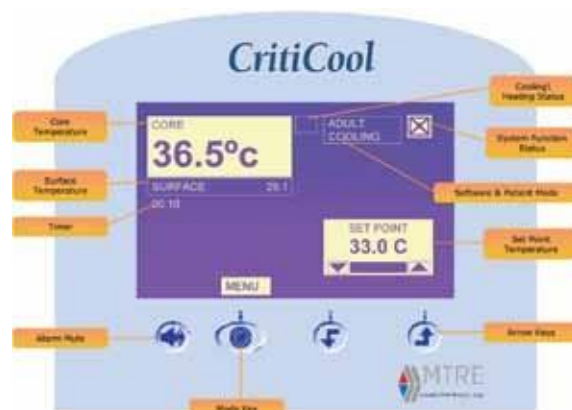
Ovládací panel termoregulace

Ohřev Řízený, automatický Postupný návrat na normální tělesnou teplotu